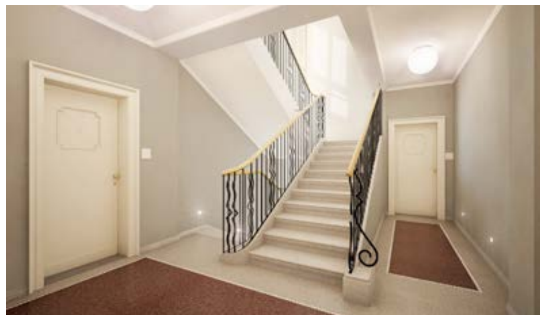
Projekt: Palác Dlouhá

Когда мы выбираем квартиру в историческом здании, то часто даже не задумываемся, что перед нами в этом месте уже жили несколько поколений. И каждое из них оставило определенный отпечаток. При этом покупка квартиры в исторических частях Праги имеет много общего с покупкой антикварных ювелирных изделий – каждое имеет свою историю, от каждого исходит определенная аура, которая нам может или не может понравиться. Таким образом, при выборе недвижимости класса люкс в историческом объекте я считаю важнейшим энергию и атмосферу, которой обладает эта недвижимость - это как с мужчиной Вашей мечты – где при самой первой встрече вы уже чувствуете, что вы могли бы быть счастливы именно с этим человеком.